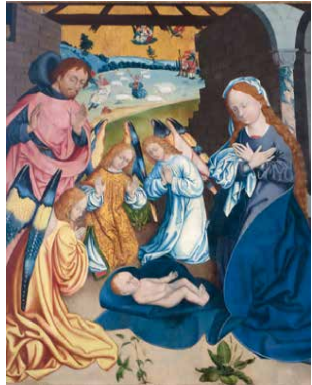
Geburt Christi, Flügelaltar Nikolaikirche Korbach (1518)